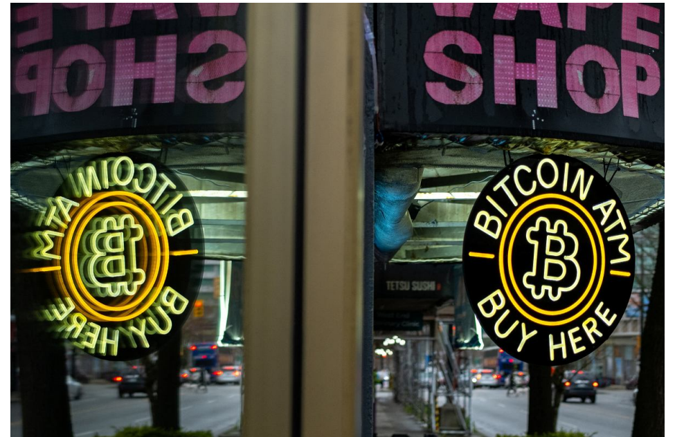
■ Mamy 330 mln dol. w bitcoinach, tylko, że nie możemy się do nich dostać - informuje Zondacrypto. Czy można złamać kod?